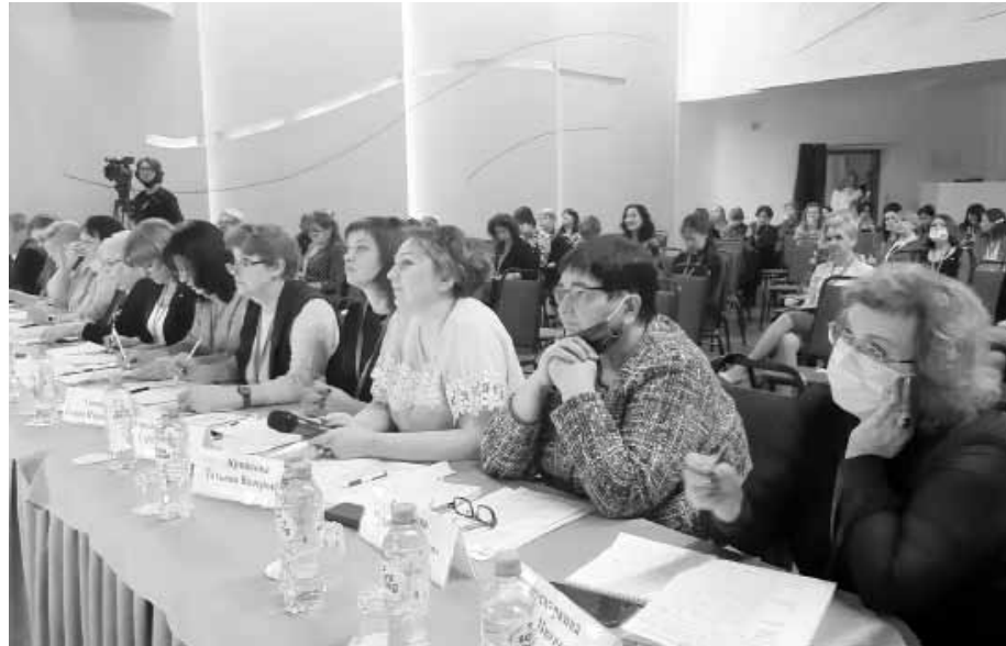
Большое жюри «Воспитателя года» - очень внимательное и благожелательное!